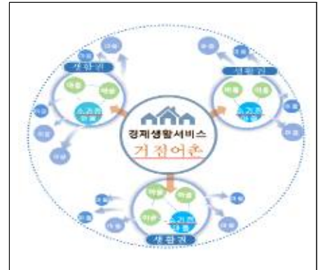
< 생활·경제 Hub&Spoke >

※ 수산물 가공·유통 단지 등 대규모 자본 필요 시설은 민간투자 유치, 어항 도입시설 확대, 절차 간소화 등 규제혁신을 통해 민간투자 여건 개선