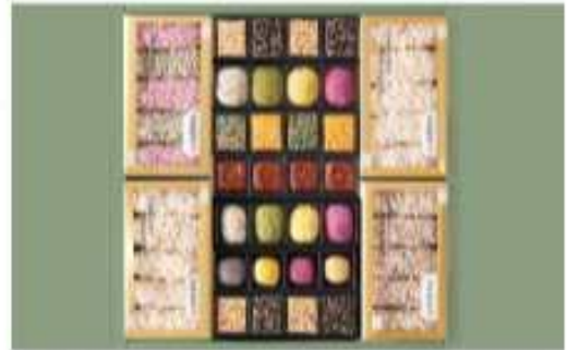
덩더쿵 (식품명인 제59호 심영숙) 청송삼씨에서 계승되는 비법으로 만든 전통 한과