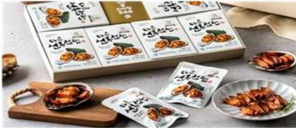
마른전복절편 (다시마전복수산) 국산 전복을 양념에 재워 건조한 간편식