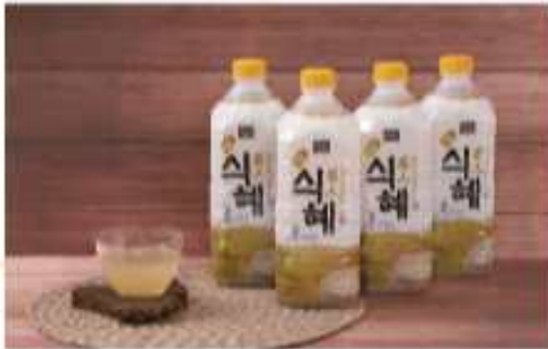
오리지널 식혜 (식품명인 제77호 문완기) 경기도 햅쌀과 국내산 엿기름으로 만든 전통 식혜