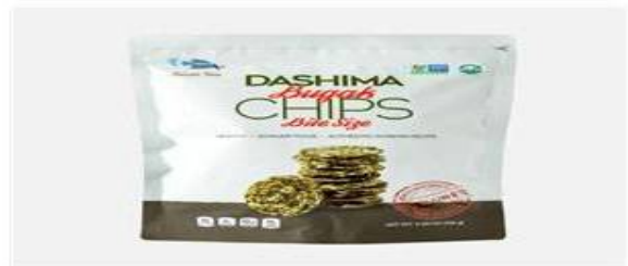
환임 다시마 부각칩 (예원) 국산 다시마와 찹쌀로 만들어 간식 또는 반찬으로 좋은 다시마 부각칩