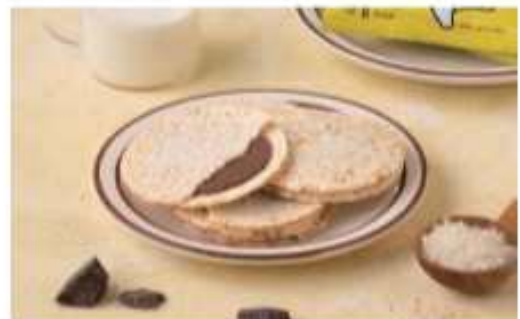
달칩초코샌드 (네이처오다) 국내산 유기농 쌀을 열과 압력으로 구운 달콤한 라이스칩