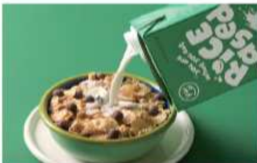
라이스베이스드 (신세계푸드) 가치소비 트렌드에 맞춘 100% 식물성 쌀 음료