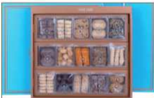
하레하레 쿠키 (하레하레베이커리) 특허받은 글루텐 분해 유산균(11종)이 포함된 가루쌀쿠키