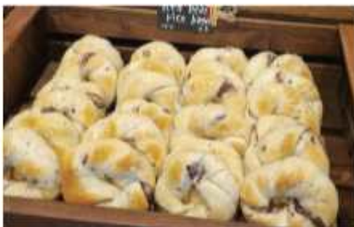
단팔쌀베이글 (런던베이글) 웨이팅 빵 맛집으로 유명한 런던베이글의 한국적 빵