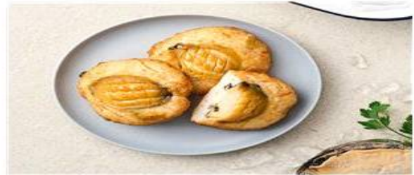
고래사 전복어묵 (늘푸른바다) 국산 전복을 통째로 넣어 풍미가 좋은 어묵