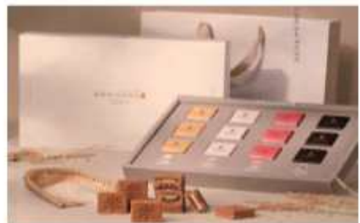
샌드쿠키 (유동부치아바타) 건강빵집으로 유명한 유동부치아바타의 고품격 가루쌀 쿠키