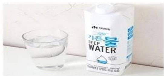
Just 기론 물 (자연드림) 깊은 바다 600m 이하에서 깨끗하고, 미네랄이 풍부한 해양심층수로 만든 깨끗한 물