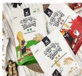
슈기농 김스낵 (청산에식품, 성경식품) MZ세대 취향을 반영해 다양한 향을 첨가한 김스낵과 전통 프리미엄 건강 김부각