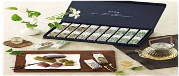
별해별味 양갱 (대두식품) 제주산 우뭇가사리, 감태, 국산 해삼, 다시마를 감귤, 홍차, 말차와 어우러지게 만든 양갱