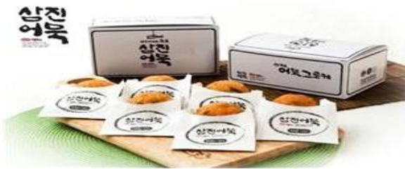
어묵고로케 (삼진어묵) 최고급 연육을 사용해 바삭하게 튀겨낸 간편식