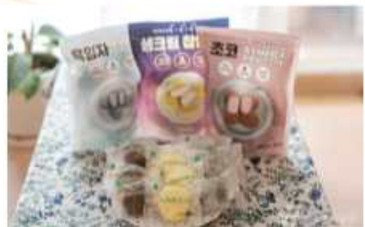
생크림찹쌀떡 (악산농협) 아이스크림+빵+떡의 식감으로 몽절 대란을 가져온 찹쌀떡