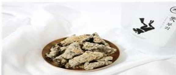
고내삼촌 툇부각 (그레고내바다) 고소한 김에 오독한 식감의 툇을 더해 맛과 영양을 살린 툇부각