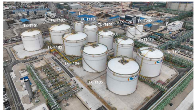
울산항 오일허브 1단계(KET 3단계)