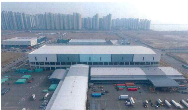
인천신항 로지스밸리 물류창고 신축