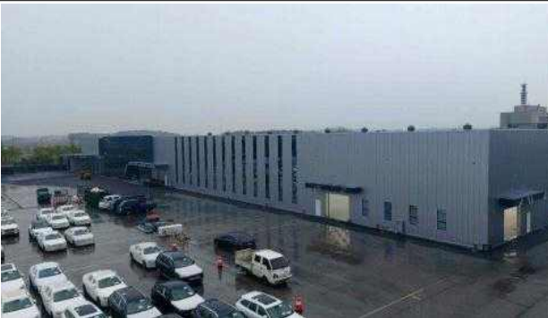
평택항 피엘에스 자동차 관련시설 설치