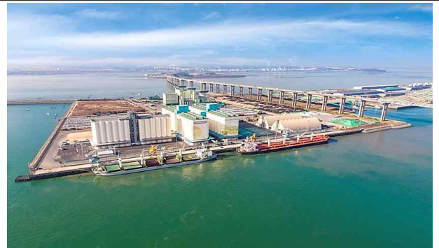
평택항 양곡부두 사일로 설치