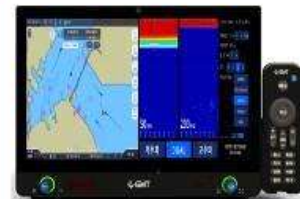
13인치, 어군탐지기능 연동(GN-E1300F)