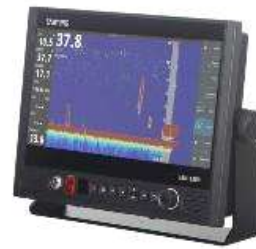
13인치, 어군탐지기능 연동(SEN-1300F)