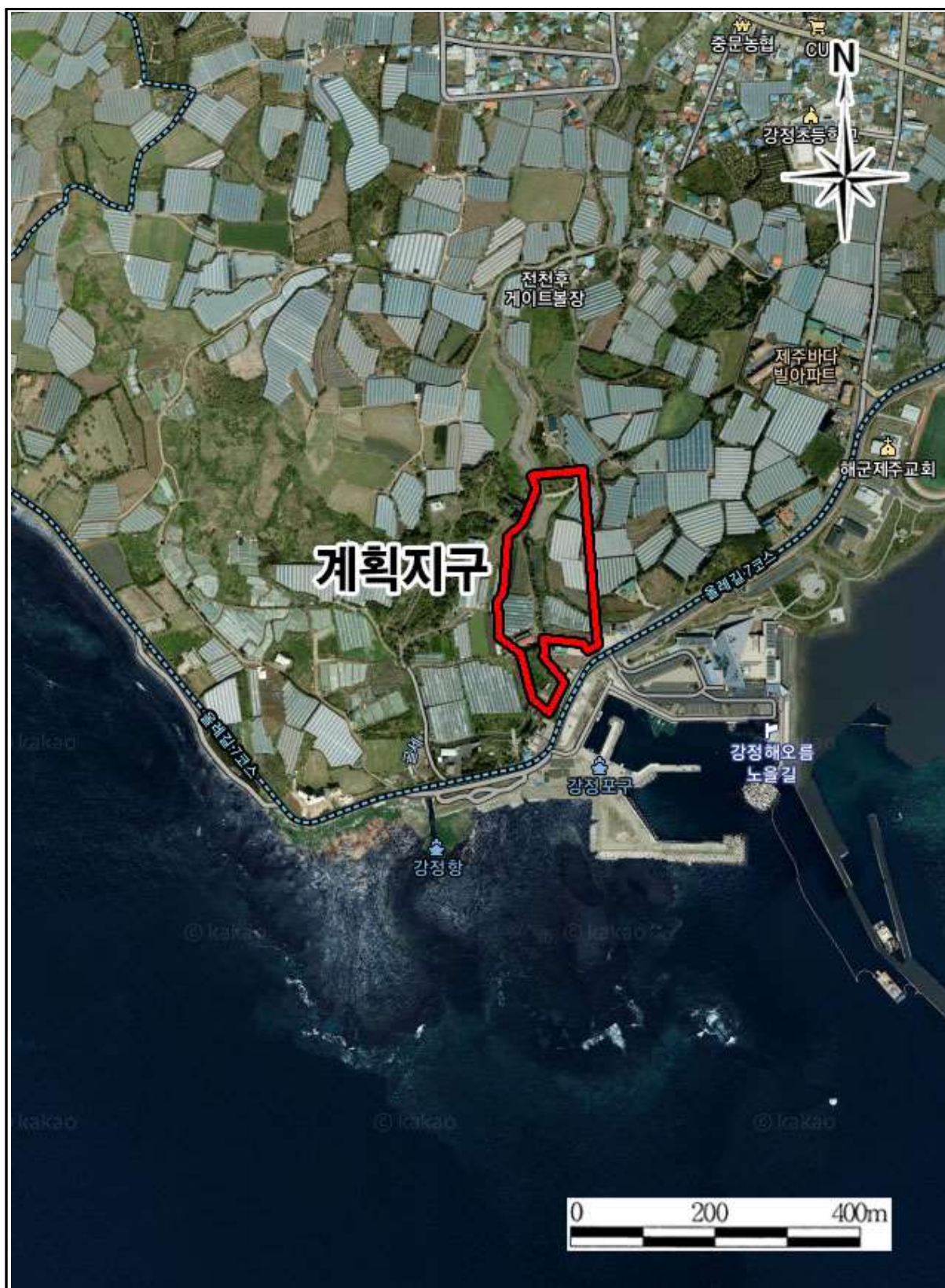
(그림 2) 계획지구 위성(금회 증가)