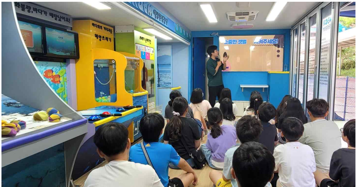
▲ 이동교실 교육 사진