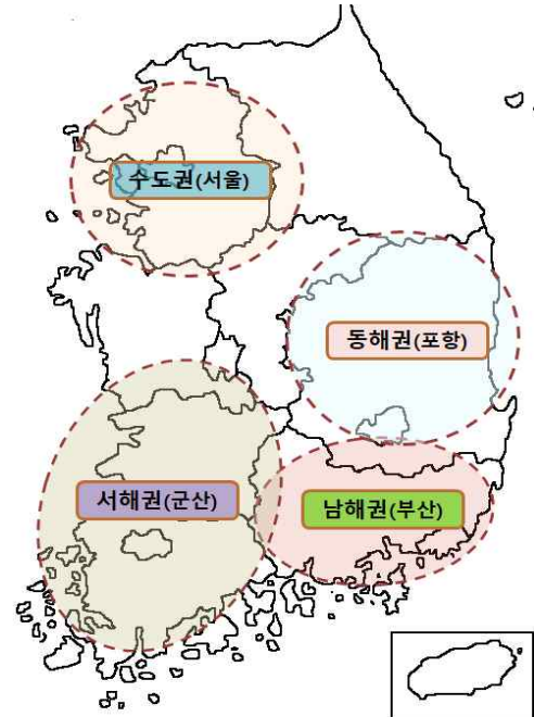
<해양환경 이동교실 권역별 배치 현황>

2016년 남해권 운영을 시작으로 2024년 현재 수도권과 동해권, 서해권까지 총 4개 권역에서 운영 중입니다.