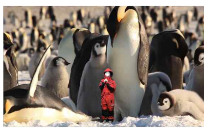
<극지 영상 재현>