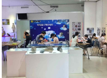
<아리온호 모형 조립 대회('22년)>