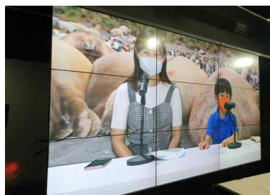
<극지방송 리포트 체험('22년)>