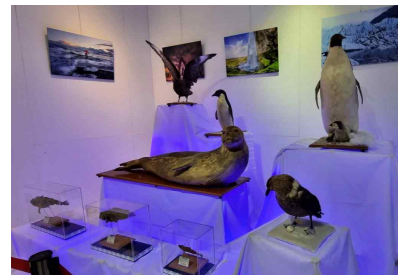
<극지 생물모형 전시('22년)>