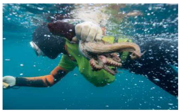
가슴엔 소라를 담고, 손에는 문어를 잡은 해녀의 모습