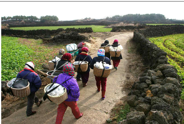
제주 발담 길로 물질하러 가는 해녀들