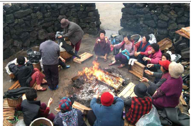
불턱에 모인 해녀공동체