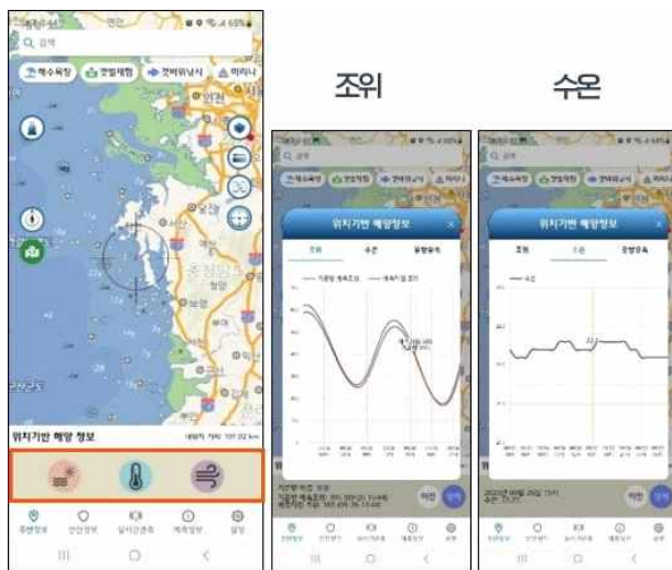
사용자 위치기반 해양정보 표출