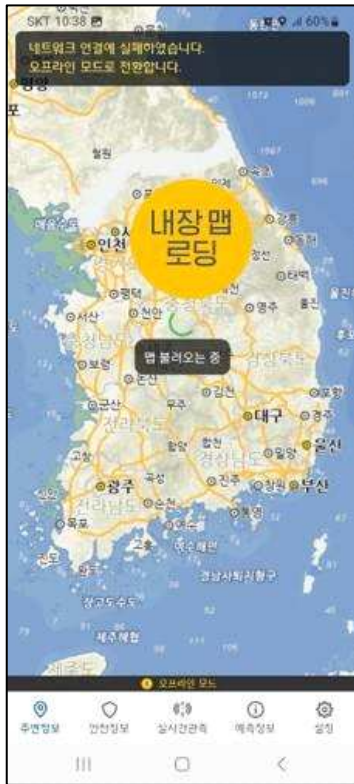
단말기 내 배경지도 저장