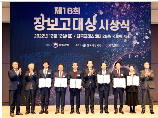
수상자 및 시상자