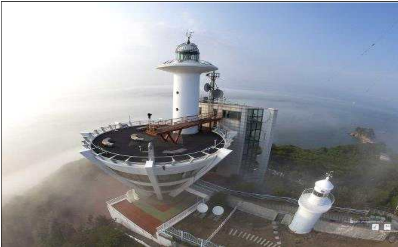
팔미도등대 전체 전경 [新등대(좌), 舊등대(우)]