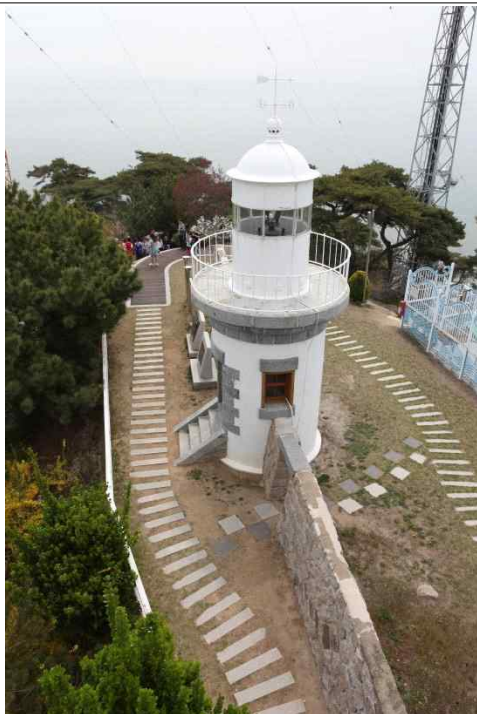
구 등탑(1903년 건립, 7.9m)