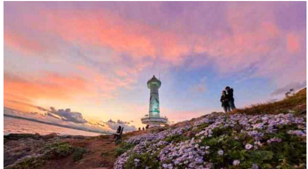
(우수상 1) 해국과 등대_김성자