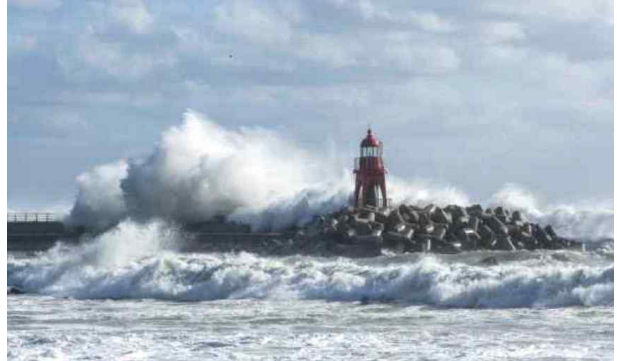
(최우수상 1) 등대와 파도_권영만