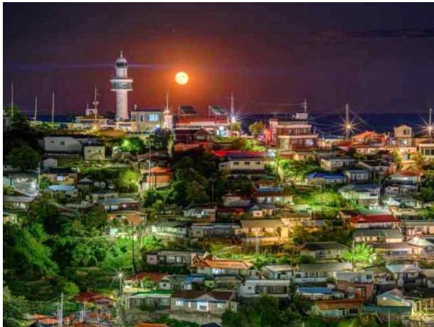
(최우수상 2) 바다의 등불_서영균