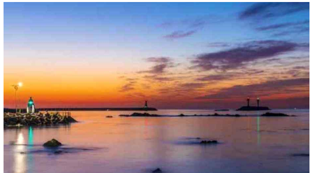
(우수상 3) 불 밝힌 세 등대_이주화