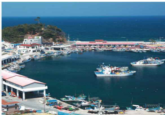
투발루 어촌 특화개발 사업 모델