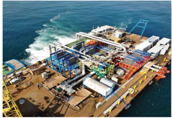
마셜제도 해수온도차 발전사업