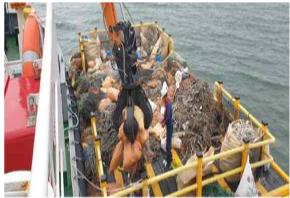
해양 플라스틱 생애주기 관리 사업