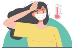
발열, 메스꺼움, 근육통