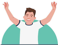
건강상태 좋을 때 접종