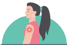
접종부위 통증, 부기, 발적

예방접종 후에 아래와 같은 증상이 흔하게 발생할 수 있으며, 이는 면역이 형성되는 과정에서 나타날 수 있는 반응으로 대부분 2~3일 이내에 사라집니다.