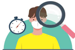
접종기관에서 이상 반응 관찰