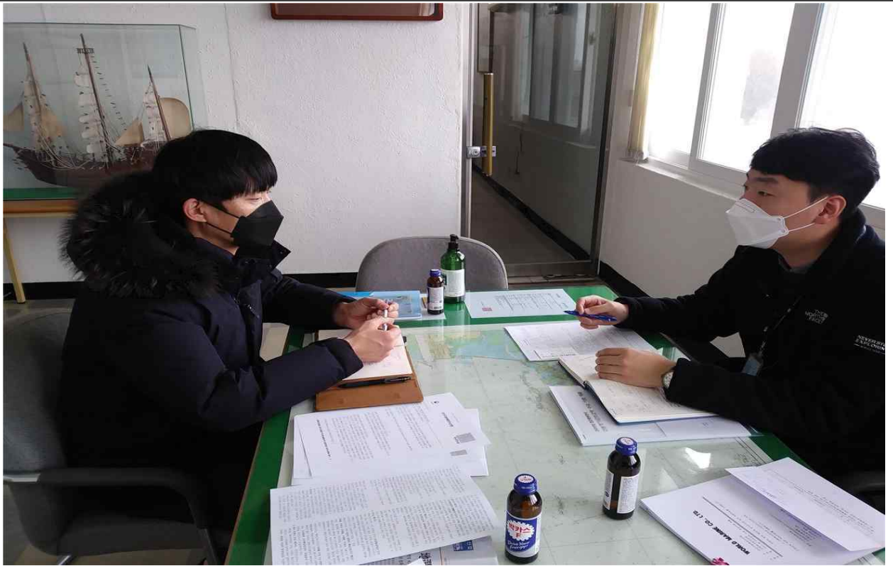
2021년 설 명절 선원 임금채불 해소 독려활동