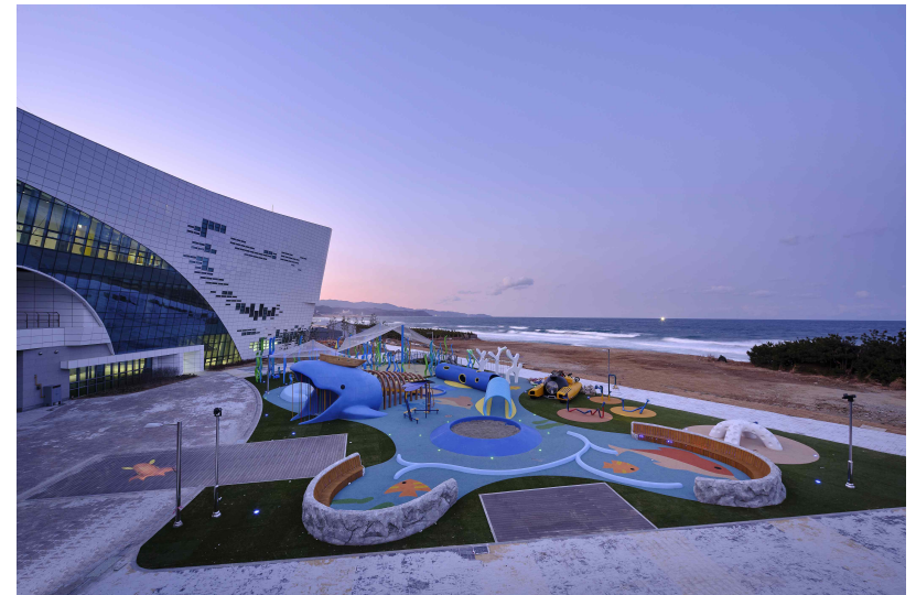
국립해양과학관 나에게ON바다 행사 장소