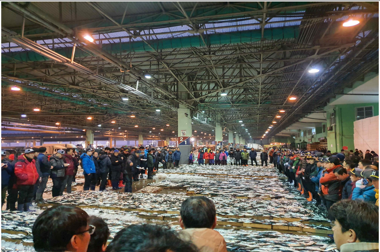
수산자원조사원들이 위판장에서 확인하는 모습