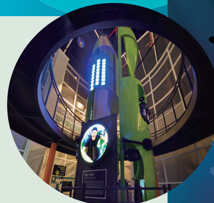
▲ 딥씨 챌린지 프로젝트