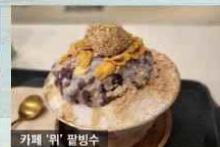
카페 '뽕' 꿀빙수