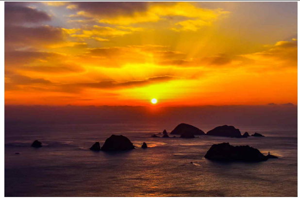
전망대에서 바라 본 대손대도

7월 ‘이달의 무인도서’로는 지형적·생태적 특성과 아름다운 자연경관을 고려하여 절대보전무인도서로 지정·관리하고 있는 대손대도를 선정하였다.