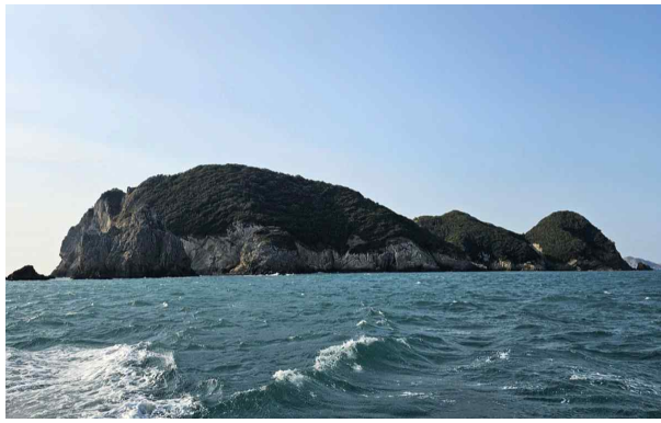
대손대도 전경