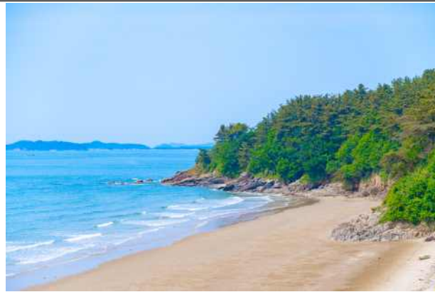
삽시도마을의 진너머 해수욕장