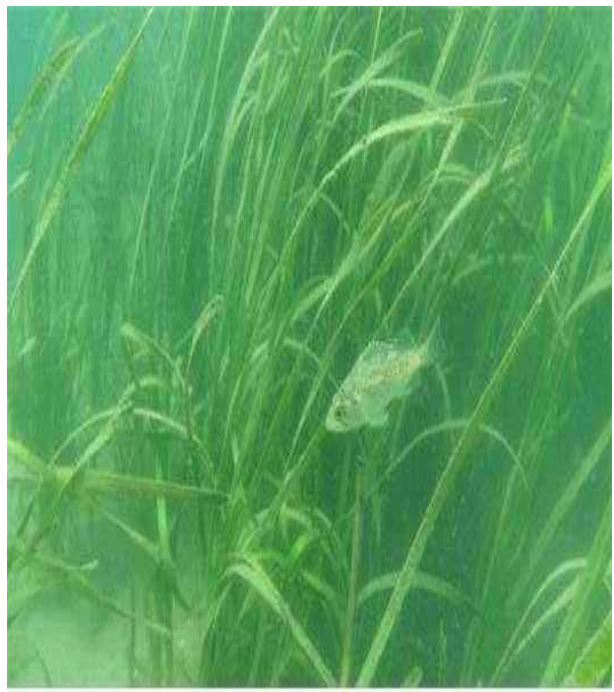
남해안 잘피숲 조성 (협력기업: KB국민은행)