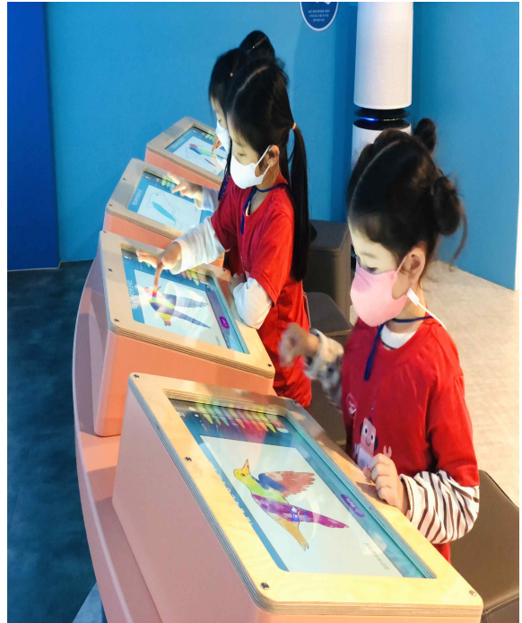
어린이 해양환경체험관 운영 (협력기업: 현대자동차)