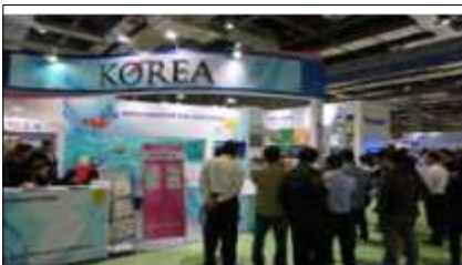
해외박람회 한국관 운영