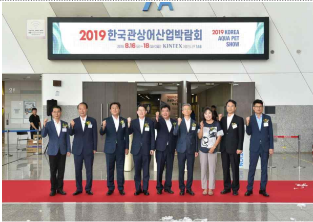
제5회 관상어산업박람회 모습