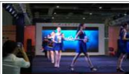
패션쇼를 방불케하는 홍보