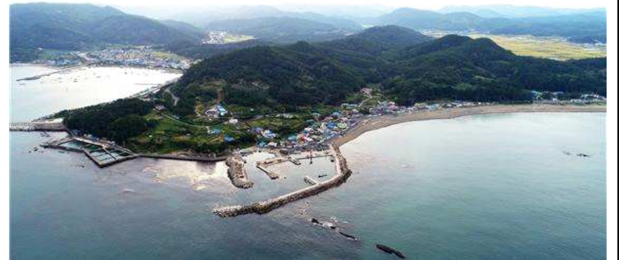
경북 포항 신창2리항 전경('19년 대상지)