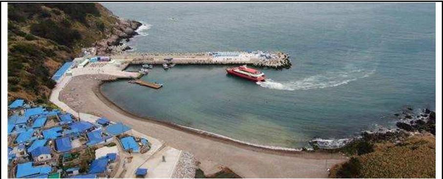
전남 신안 만재항 전경('19년 대상지)