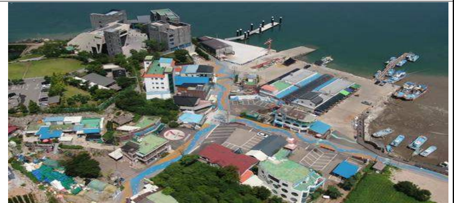
인천 강화 후포항 전경('19년 대상지)