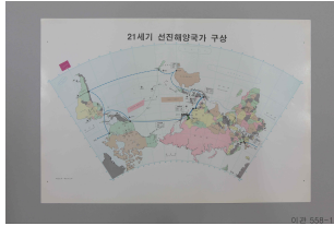
거꾸로 보는 세계 지도