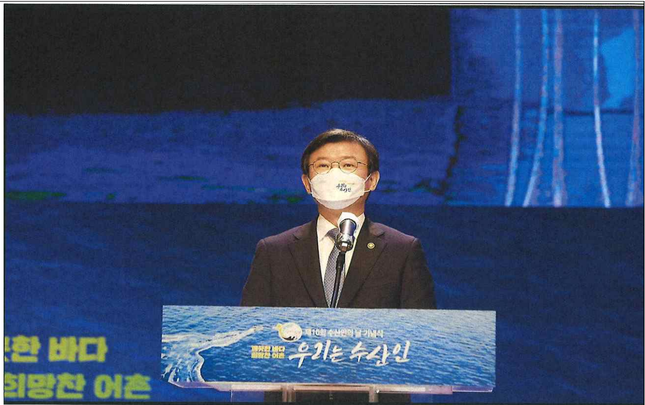
2021년 4월 1일, 제10회 수산인의 날 기념식에서 문성혁 장관의 기념사