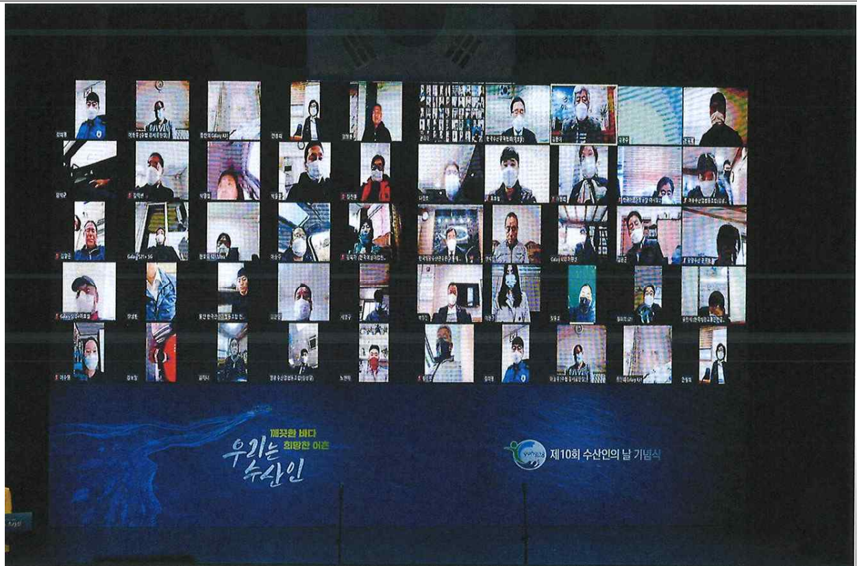
2021년 4월 1일, 제10회 수산인의 날 기념식에서 비대면 온라인 퍼포먼스 행사장면